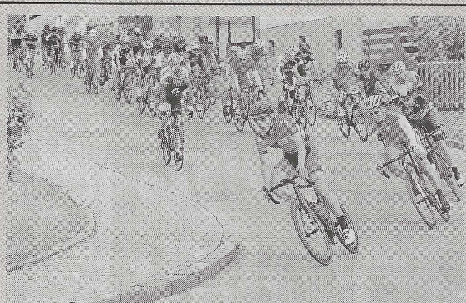
Wenn es den Berg herunter geht, entwickeln die Sportler ein beeindruckendes Tempo.