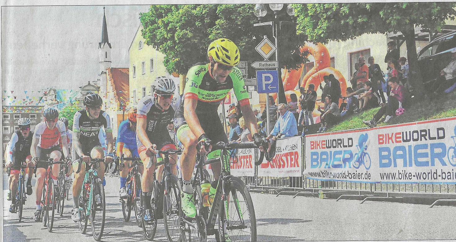
Das Veldener Radkriterium gilt als eines der anspruchsvollsten Deutschlands. Der Marktberg kurz vor dem Ziel hat es in sich.